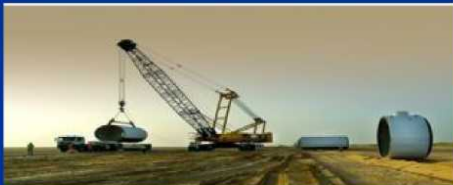
Al Khufra Tazerbo Water Transmission Line-, Libien