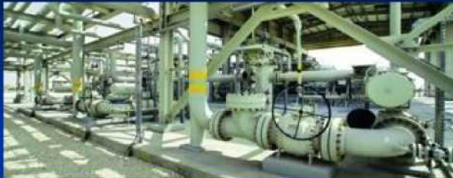
Ras Laffan Mesaieed Etan Pipeline, Qatar