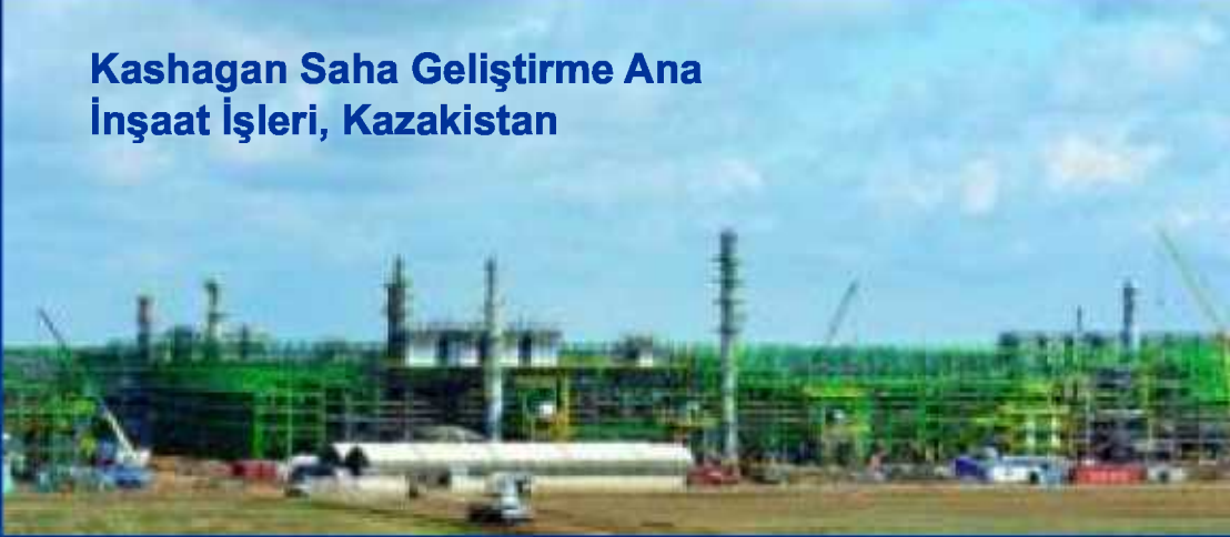
Kashagan Saha Geliştirme Ana İnşaat İşleri, Kazakistan